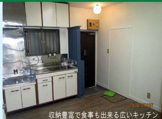
2020/09/07 収納豊富で食事出来る広いキッチン