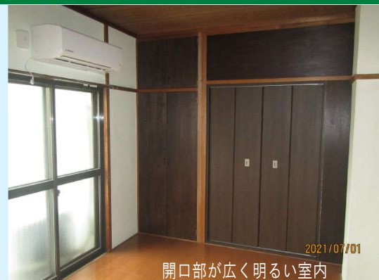
2021/07/01 開口部が広く明るい室内